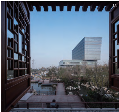
06-08. 城市展馆和会议综合体 09-11. 办公会议大楼 12-14. 实景图