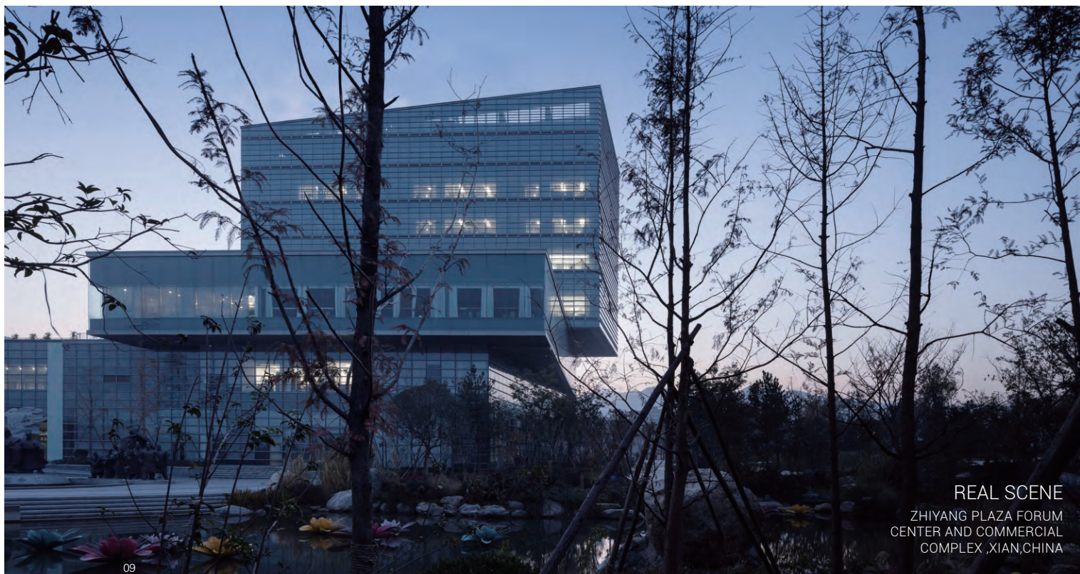
REAL SCENE ZHIYANG PLAZA FORUM CENTER AND COMMERCIAL COMPLEX ,XIAN,CHINA