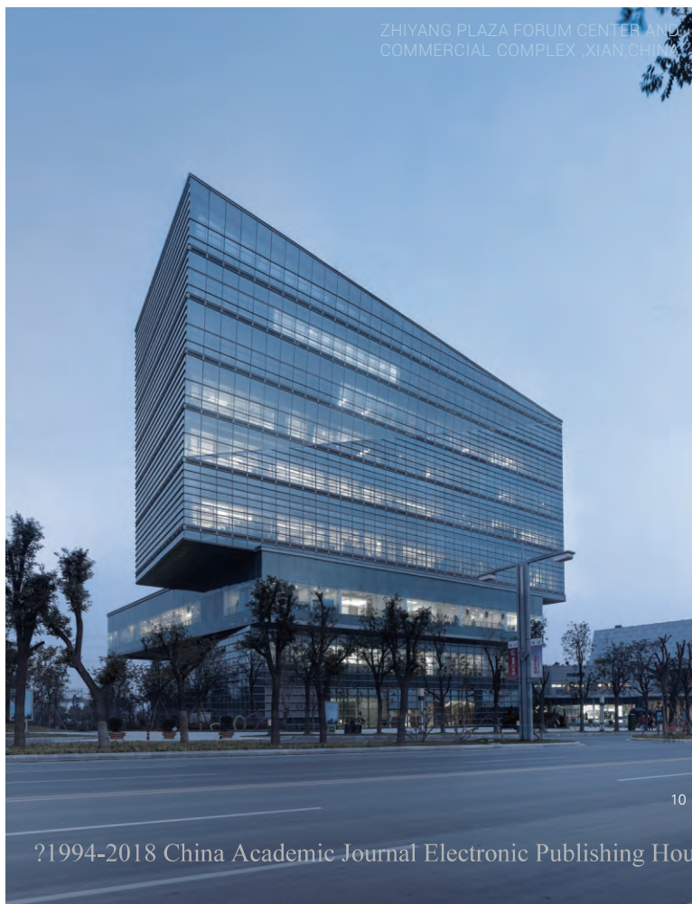
ZHIYANG PLAZA FORUM CENTER AND COMMERCIAL COMPLEX ,XIAN,CHINA