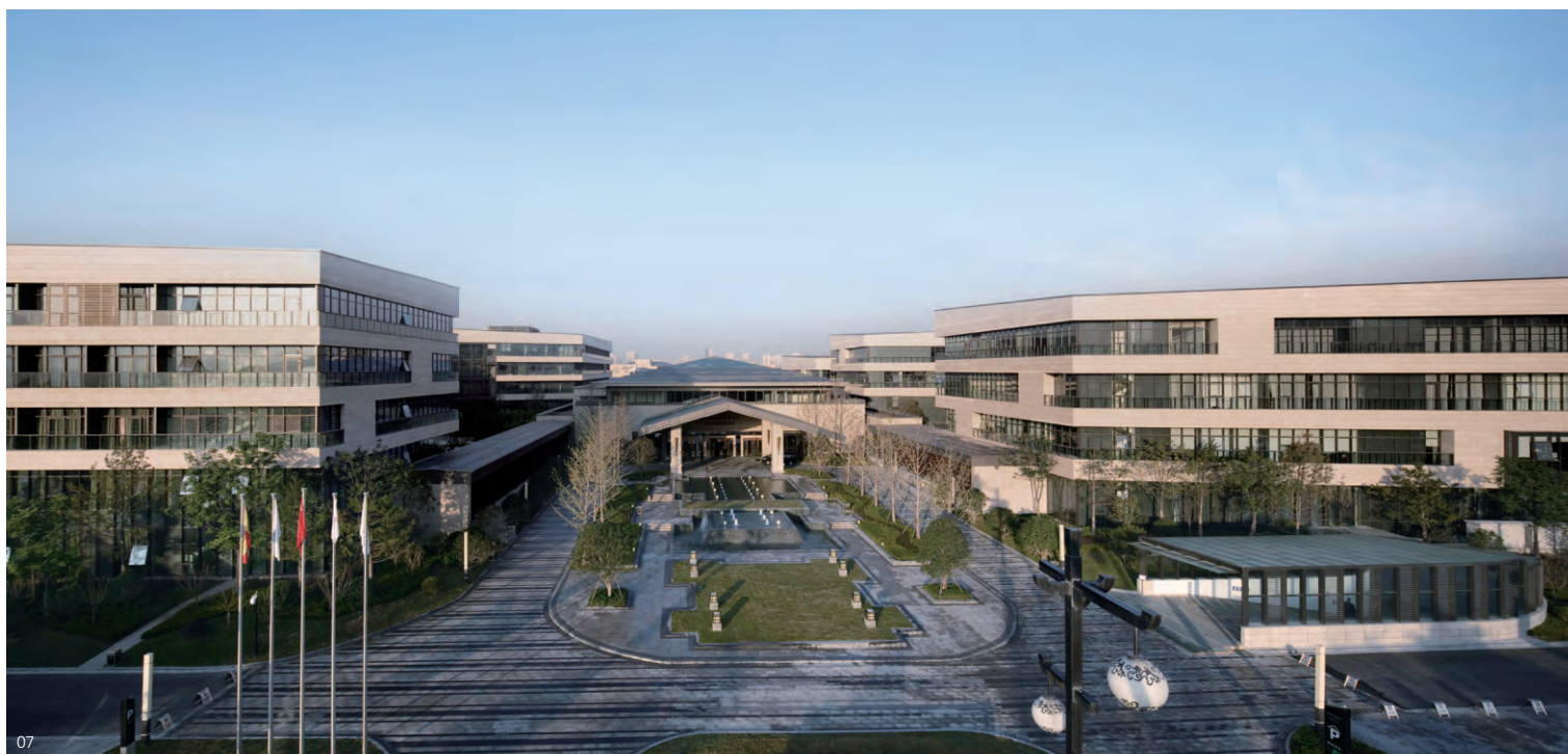
FACADE AND MATERIALS GRAN MELIÁ HOTEL IN XI'AN